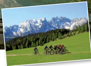
L'archivio fotografico del consorzio turistico Rosengarten-Latemar

L'area vacanze Rosengarten-Latemar è situata alle porte delle Dolomiti, le montagne più belle del mondo (Reinhold Messner). Così belle ed ineguagliabili che nell'estate 2009 sono state proclamate dall'UNESCO Patrimonio naturale dell'Umanità. Le magiche cime del Catinaccio, Latemar, Corno Bianco e Nero abbracciano un'area unica e favolosa per gli amanti della natura. 800 km di "trails" per mountainbike, facili escursioni o trekking impegnativi, vie